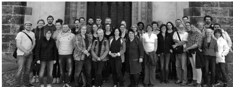
Mitarbeiterausflug nach Wittenberg, Foto: G. Lehmann